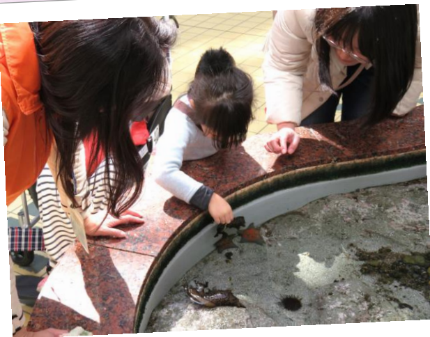
ボランティアとエサやり体験。

今年もアメフラシをタッチタンクで展示する季節がやってきました。この生き物は寿命が1～2年と言われており、夏を迎える前に産卵し、命を終えてしまうので展示は期間限定です。今年は新しく、お客様に「エサやり」をしていただく体験を始めました。アメフラシの本来のエサは海藻ですが、入手しやすく同じ植物性ということで「キャベツ」を与えています。触ることに抵抗があっても、エサをやると愛着がわくのか平気で触れるようになるお客様もいらっしゃいます。